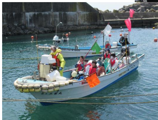
← 漁業体験 (待浜:横沼漁港)